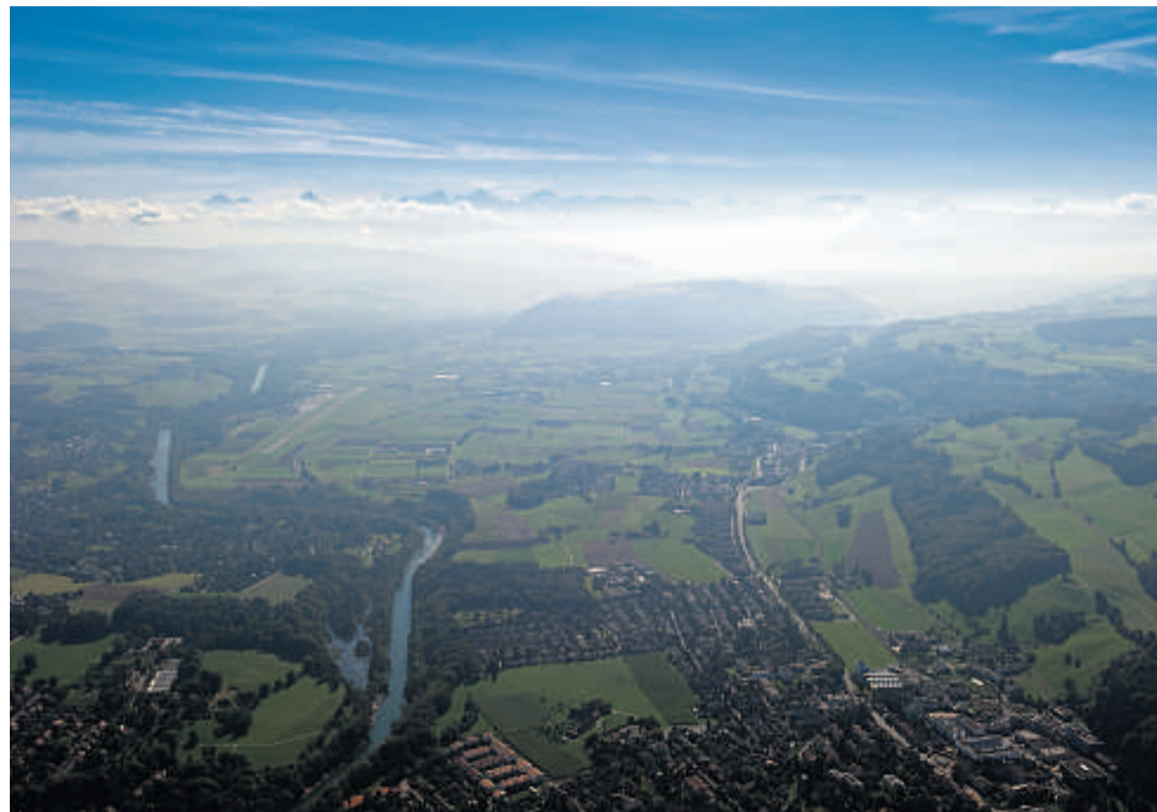
In Bern wird über eine Grossfusion diskutiert. Betroffen wäre auch Muri (links), rechts das Quartier Wabern.

In Bern gibt es verhältnismässig viele Kleingemeinden, aber unterdurchschnittlich wenige Städte.* Gemeindefusionen stehen die Berner eher skeptisch gegenüber: 16 Zusammenschlüsse mit 34 Gemeinden kamen seit 2004 zustande, doch alle grösseren Projekte mit mehreren Gemeinden scheiterten. Der Kanton will Fusionen