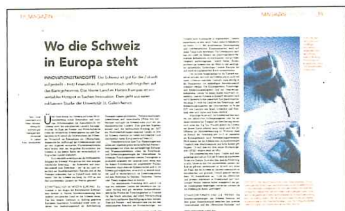
Mehr im «Swiss Innovation Guide 2010» der «Handelszeitung», der am 4. November 2009 erscheint.

Sponsoring Finanziert wurde die intensive Feldrecherche durch die