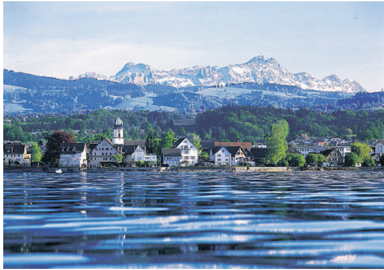
Der Sântis, unübersehbares Markenzeichen der Ostschweiz, aus der Perspektive von Steinach am Bodensee.

Die Voraussetzungen für eine Expo in der Ostschweiz sind besser als für eine rund um den Gotthard. Bis zu einer Realisierung steht genügend Zeit zur